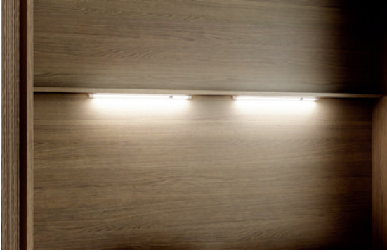
Led 25 - zwei einzeln einschaltbare Lampen mit integriertem Switch und Dimmer Funktion.